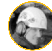
Michael Van de Peer Productie