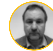
Kris Ost Administratie